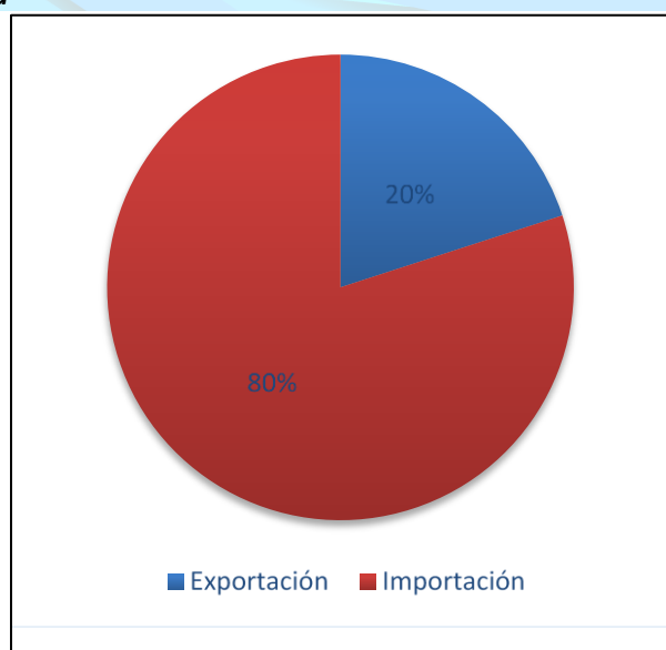
Figura 1. Envíos de mercancía

Las fronteras representan el principal medio por el cual se deben manejar él envió de mercancía, en donde los productos son los más factibles para lograr nuevos cambios satisfactorios y mejorar los procesos directos para que las empresas sean los aspectos principales para los envíos. En la actualidad la mayoría de las empresas manejan importaciones en un 80,00% y las demás empresas se evidencia un 20,00% de envió en cuanto a exportación de manera didáctica y concreta de forma más amplia, colocando en práctica cada uno de los documentos de exportación.